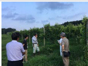
市内ワインフルーツ酒特区の視察風景