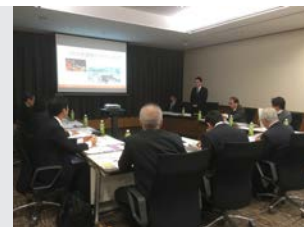
つくば市議会だよりについての視察受け入れ。前委員長として概要を説明させて頂きました（写真 右）