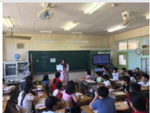
関東若手市議会議員の会茨城ブロック研修の様子。牛久市の小規模特認校を視察