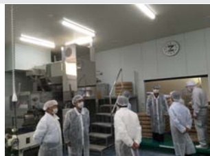
市内地場産業の視察風景